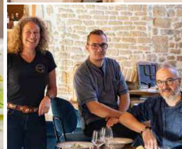
Miel de la Fermette aux Avettes à Augé